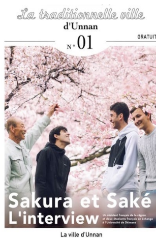
雲南市パンフレット