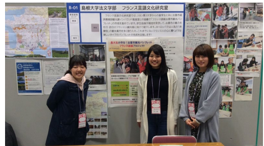
しまね大交流会での活動紹介