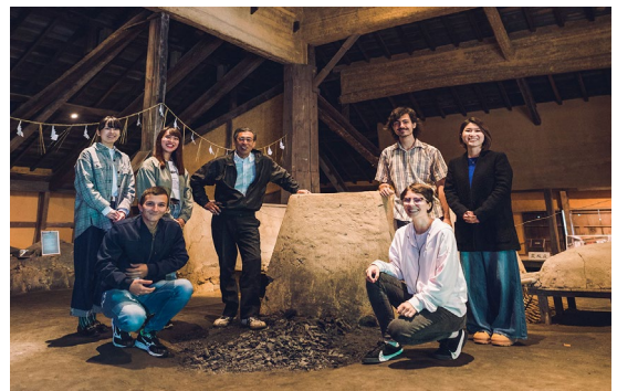
雲南市菅谷たたら山内（高殿）見学