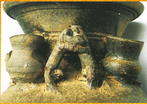
島根県浜田市所在めんぐる古墳出土の装飾付子持壺

古代出雲では古墳時代後期に個性的な古墳が築かれ、多くの埴輪が作られ、その一つに力士埴輪があります。『日本書紀』の話によると、出雲から朝廷に呼び寄せられ相撲の開祖になったとされる野見宿禰(のみのすくね)は、また人物埴輪づくりを提言したともされています。これは説話でありそのまま歴史的事実とするわけにはいきませんが、今回のフォーラムでは、古代出雲の古墳祭祀、それにまつわる相撲や儀礼の歴史について考えていきます。