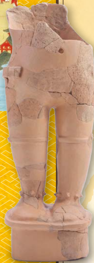
島根県松江市石屋古墳出土の力士埴輪 (松江市所蔵)