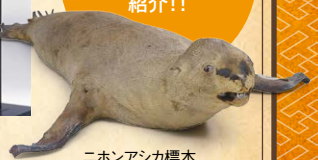
ニホンアシカ標本