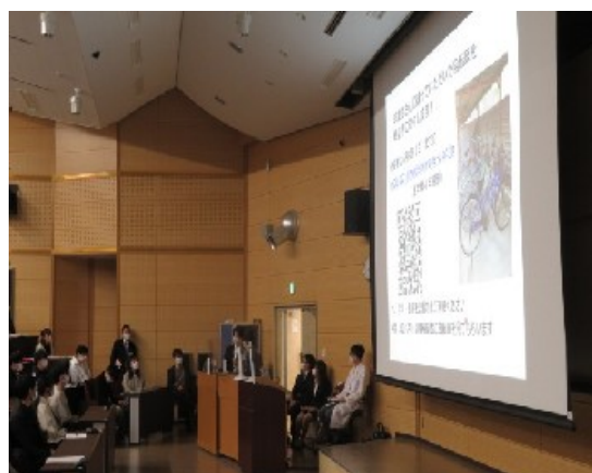
学部新入生オリエンテーション研修