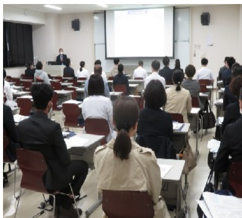
大学院新入生オリエンテーション研修