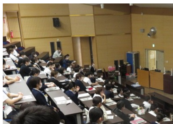
新任看護師、医療職員研修