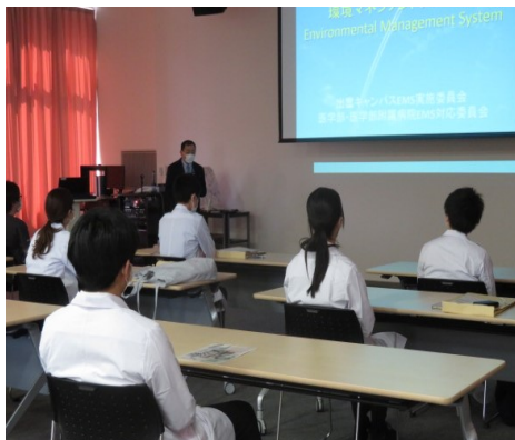
医科研修医・歯科研修医研修

また、5月には全職員対象のEMS基本研修を計画していますので、回答方よろしくお願ひします。