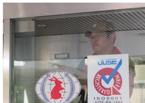
プレート等撤去作業の様子