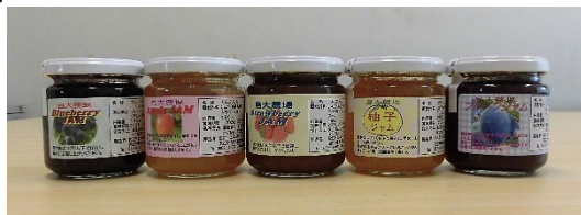
農場で栽培・加工した オリジナルジャム