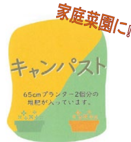
島根大学生協食堂の食品廃棄物から 作った有機質肥料です