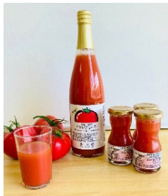
農場で栽培したトマトで作った 無塩のトマトジュース