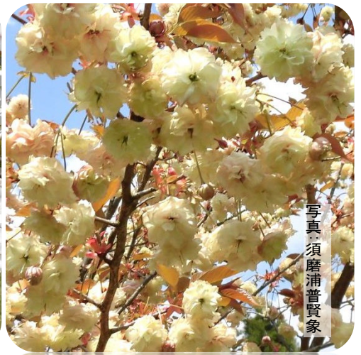
写真 須磨浦普賢家