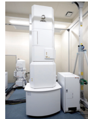
NEXTA 原子分解能磁場フリー電子顕微鏡