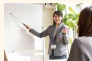
※写真・イラストはイメージです。

島根大学生物資源科学部附属本庄総合農場及び三瓶演習林で、専門的な実習を行います。