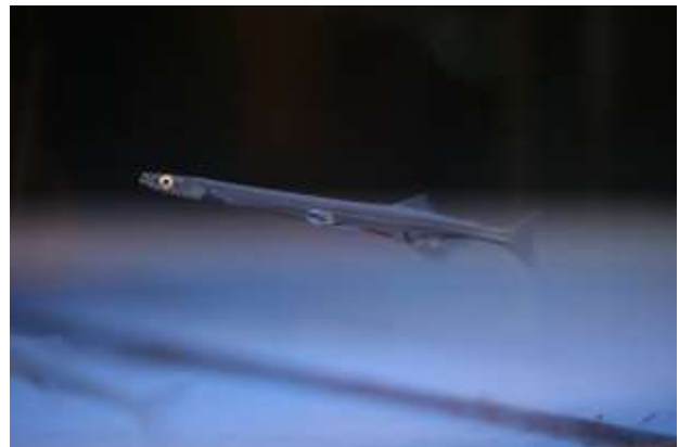
本研究の対象魚 2 種(左:ワカサギ、右:シラウオ)