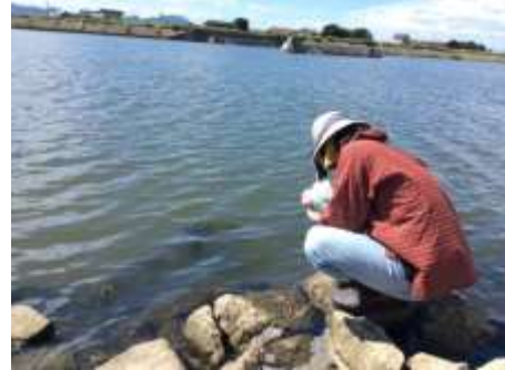
平田船川における調査風景(左:投網による捕獲調査、右:環境 DNA 用の採水作業)