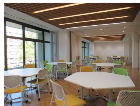
■ アクティブラーニングスペース