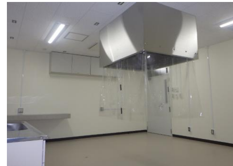
■ 内観（歯科口腔外科学第1研究室）