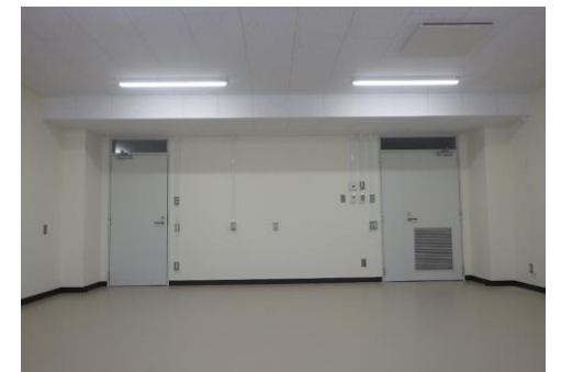
■ 内観（麻酔科学第2研究室）