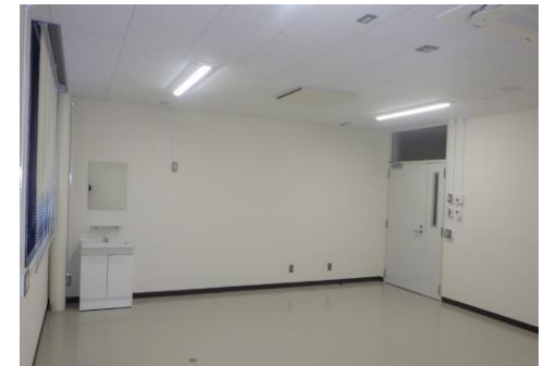
■ 内観（歯科口腔外科学第2研究室）