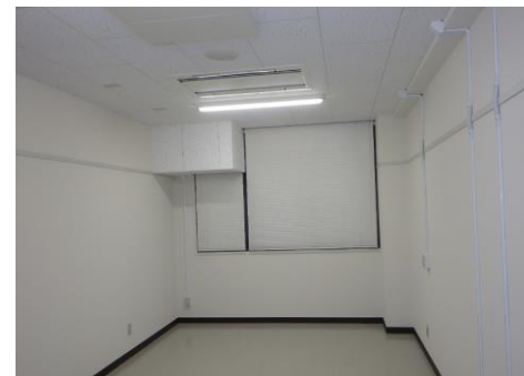
■ 内観（放射線医学准教授室）