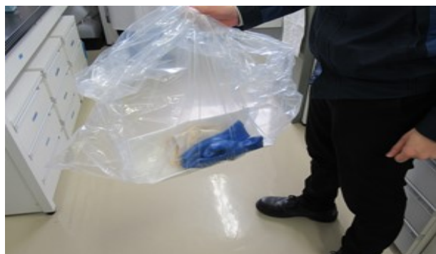
緊急事態テストの様子