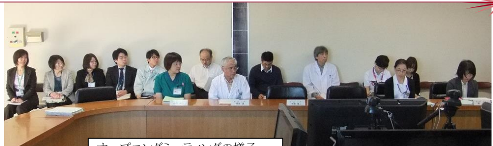
オープニングミーティングの様子