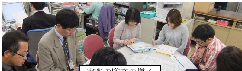
実際の監査の様子

11月に平成26年度の内部監査を実施しました。監査チームは、内部監査・スキルアップ研修に合格した内部監査員の資格を持つ教職員で編成しました。(1チーム5名ずつ計6チーム) 監査は、実地監査前に被監査部局等へチェックリストを送付、回答されたチェックリストを基に各内部監査チームでどういった監査を実施したらよいか検討(レター監査)を行い、その後実地監査に臨むという方法により実施しました。附属病院で普段勤務している教職員が医学部へ、医学部で勤務している教職員が附属病院へ赴き、実地の監査を行いました。EMS文書に基づいた指摘もあり、EMSについての認識がさらに深くなる内容の濃い監査となりました。監査結果は、有効事例が26件、観察事項が21件でした。今後は、指摘された観察事項について対応していくこととなりますので、確認、改善する事項についてはEMS推進員を通じて依頼がありましたら、ご協力方よろしくお願ひします。内部監査員の皆さま、ご協力ありがとうございました。