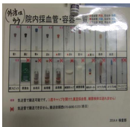
写真1:採血管の掲示 (検査部が作成されたそうです)

また、手順として指さし確認を徹底するため作業スペースに大きく表示されていました。(写真2)