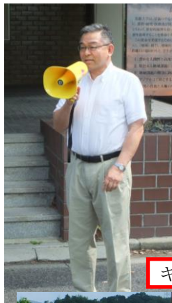
キャンパスクリーンの様子

また、今年度は5月27日に附属病院立体駐車場付近を中心とした清掃作業を計画し、病院長をはじめとした約30名の職員の協力の下、実施しました。作業終了後には軽トラック約3台分の落ち葉やごみを回収し、患者さんの声を通じてお褒めの声をいただきました。