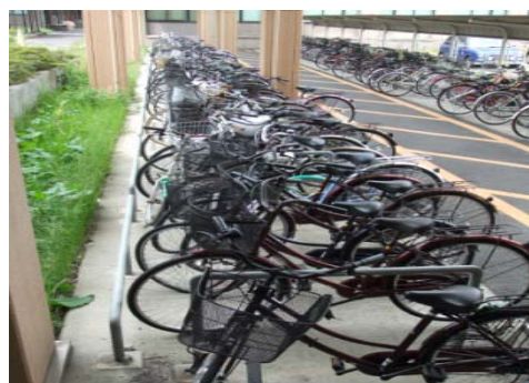
整然とした駐輪場(看護学科棟北側)