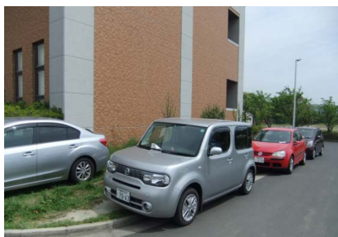
看護学科棟南側の区域外駐車

上記のように「外部委託警備員による駐輪指導等」は一定の成果を上げていると思われるので、引き続き実施したいと考えています。これを機会に出雲キャンパス全員の意識向上が図られることを願います。